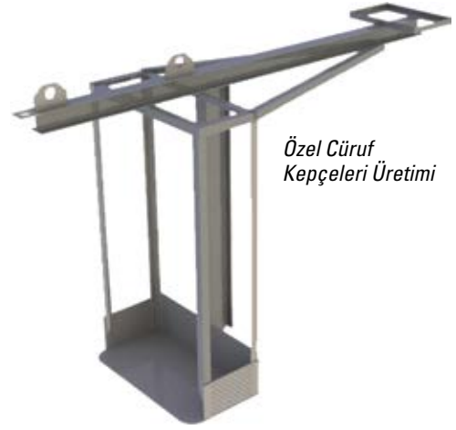
Özel Cüruf Kepçeleri Üretimi