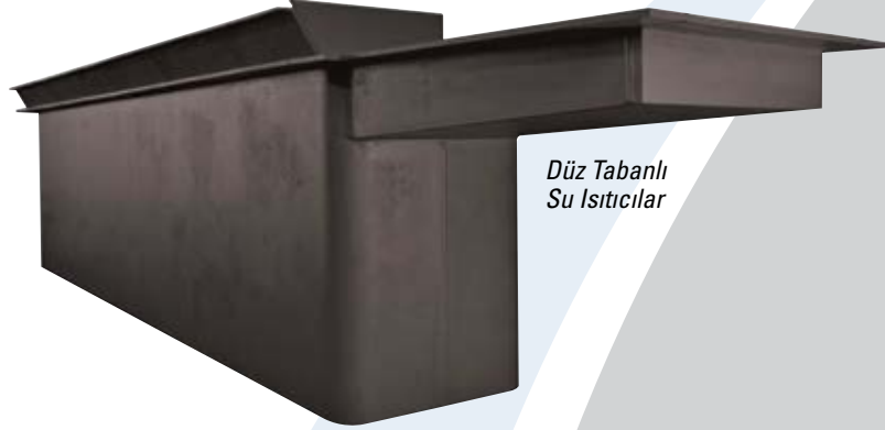
Düz Tabanlı Su Isıtıcılar

Ayrıca üretim sürecimiz tam anlamıyla standart hale getirilmiştir ve proje oluşturulduğunda sürekli bir inceleme altına girer. Nakliye öncesi nihai bir inceleme gerçekleştirilir ve bu inceleme belgelenir. Her bir müşteri, ürünleri ile birlikte ilgili tüm belgelerin bulunduğu bir veri paketi alır.