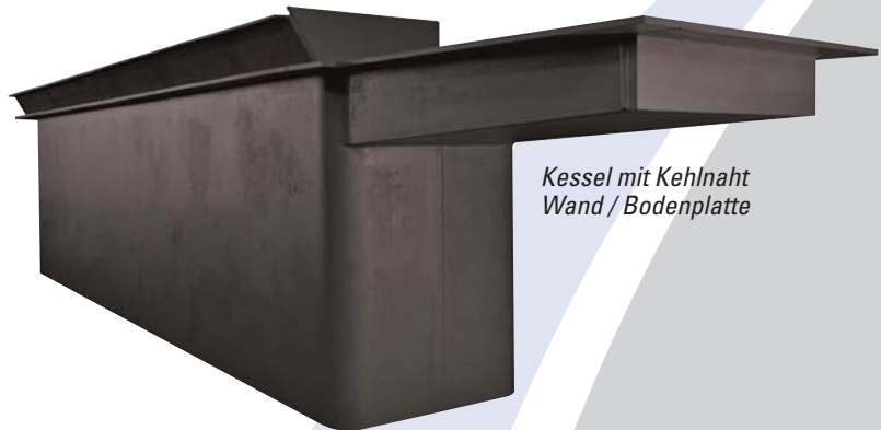
Kessel mit Kehlnaht Wand / Bodenplatte

Darüberhinaus, ist unsere Produktion vollkommen standardisiert und ist kontinuierlichen Prüfungen unterzogen. Bevor dem Versand werden nochmals alle produktspezifischen Aspekte geprüft, dokumentiert, und in einem Datenpaket für jeden Kunden zusammengefasst.