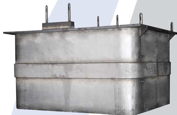
Cubas de aço inoxidável