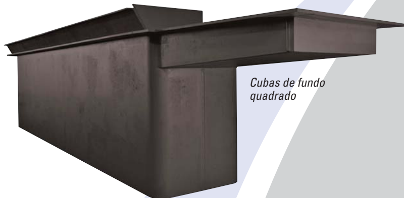
Cubas de fundo quadrado

Além disso, nosso processo de fabricação é completamente padronizado e sujeito a supervisão contínua durante a fabricação. Uma inspeção final é realizada antes do embarque, e é documentado num relatório com todos os dados técnico do produto.