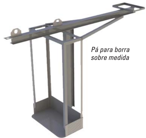
Pá para borra sobre medida