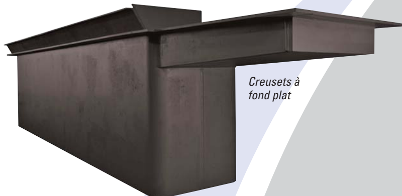
Creusets à fond plat

En outre, notre processus de fabrication est entièrement normalisé et fait constamment l'objet d'un examen minutieux durant l'exécution de tous nos projets. Un dernier contrôle est effectué et documenté avant l'expédition. Chaque client reçoit avec leurs produits un dossier complet avec tous les documents qui leur seront utiles.