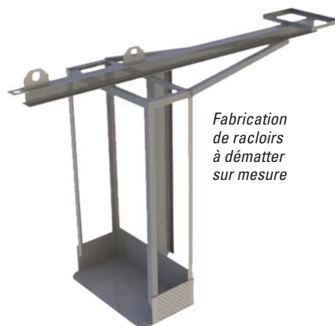
Fabrication de racloirs à dématter sur mesure